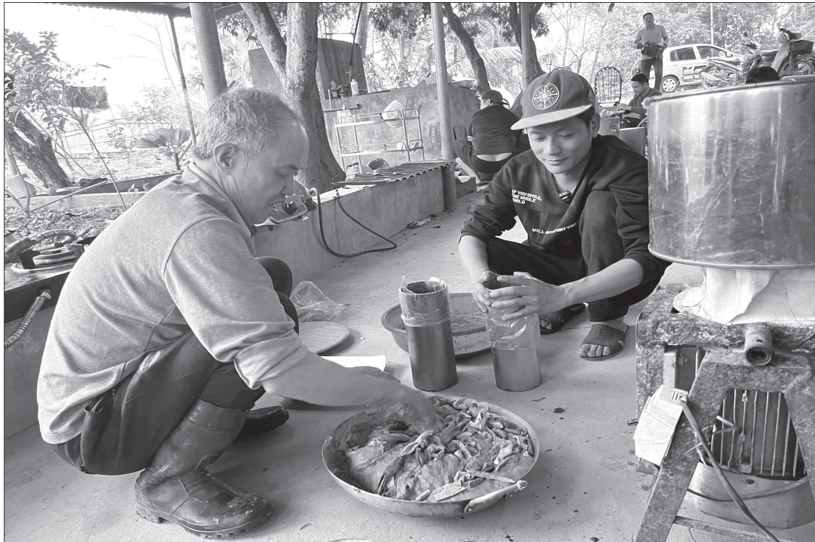
Người dân xã Trường Yên làm món giò lòng dâng cúng Tổ tiên và thết đãi du khách.