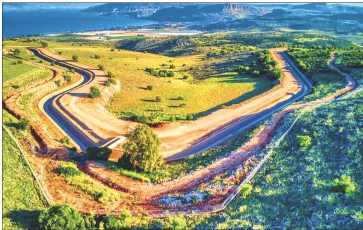
Ảnh chụp trên không của Hệ thống cung cấp nước quốc gia (NWC) - biểu tượng của sự đổi mới và quản lý tài nguyên nước bền vững của Israel.

Đầu thập niên 1950, NWC được thành lập để giải quyết tình trạng phân phối nước không đồng đều ở Israel. Với