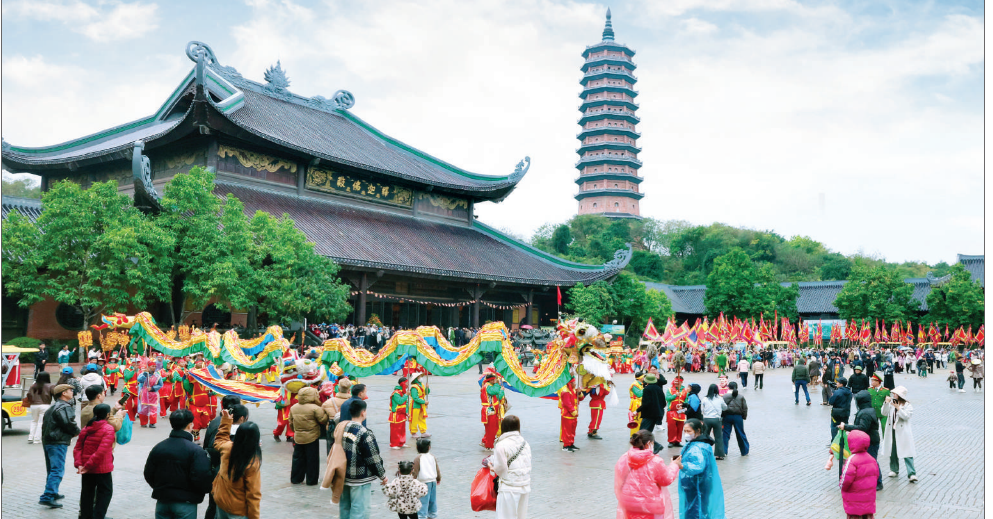
Du khách thập phương dự Lễ hội chùa Bái Đính năm 2025.