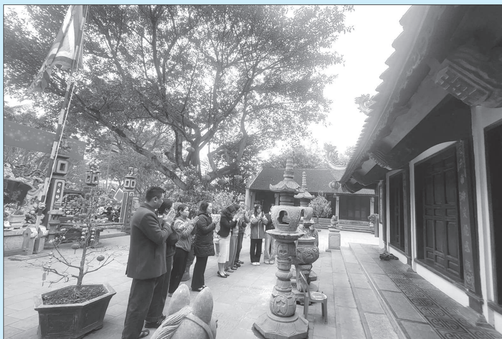
Người dân, du khách đến tham quan, chiêm bái tại Đền thờ Danh nhân văn hoá Trương Hán Siêu (thành phố Hoa Lư).