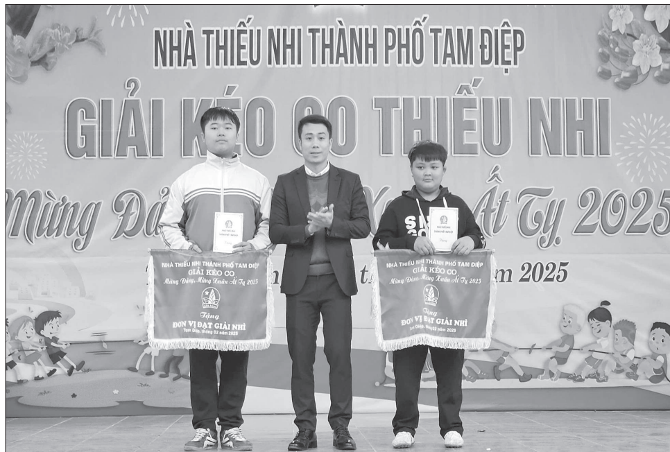
Phong trào “Toàn dân đoàn kết xây dựng đời sống văn hóa” được triển khai sâu rộng đã góp phần nâng cao đời sống tinh thần cho người dân thành phố Tam Điệp.

Một trong những phong trào thi đua nhận được sự tham gia hưởng ứng tích cực của các cấp, ngành, địa phương trong năm 2024 đó là phong trào thi đua “Cán bộ, công chức, viên chức thi đua thực hiện văn hóa công sở”. Để thực hiện hiệu quả phong trào thi đua, UBND thành phố đã chỉ đạo các cơ quan, đơn vị gắn việc triển khai với Chủ đề công tác năm của Ban Chấp hành Đảng bộ tỉnh “Giữ vững kỷ cương, tăng cường trách nhiệm, đổi mới, sáng tạo, hiệu quả thực chất” và Quy chế văn hóa công sở trong các cơ quan, đơn vị trên địa bàn thành phố. Nhờ đó, ý thức trách nhiệm, kỷ luật của cán bộ, công chức, viên chức đã được nâng cao, góp phần xây dựng đội ngũ công chức chuyên nghiệp, tận tâm phục vụ Nhân dân. Phong trào thi đua cũng đã góp phần phát huy