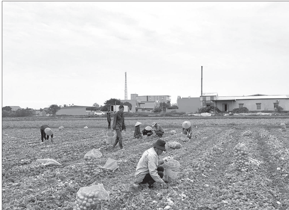
Nông dân xã Khánh Dương thu hoạch khoai tây vụ đông.

Còn trên các cánh đồng của xã Khánh Dương những ngày đầu năm mới này không khí sản xuất cũng vô cùng nhộn nhịp. Bên cạnh tập trung xuống giống lúa Đông Xuân, nhiều