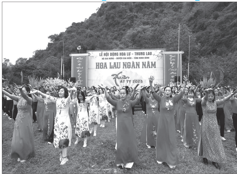
Tiết mục nhảy dân vũ tập thể của Hội Phụ nữ Gia Viễn tại Lễ hội Động Hoa Lư-Thung Lau.

Đối với nhiều hội viên phụ nữ, mỗi dịp các cấp, các ngành tổ chức hội thi dân vũ thể thao, các chị em lại hân