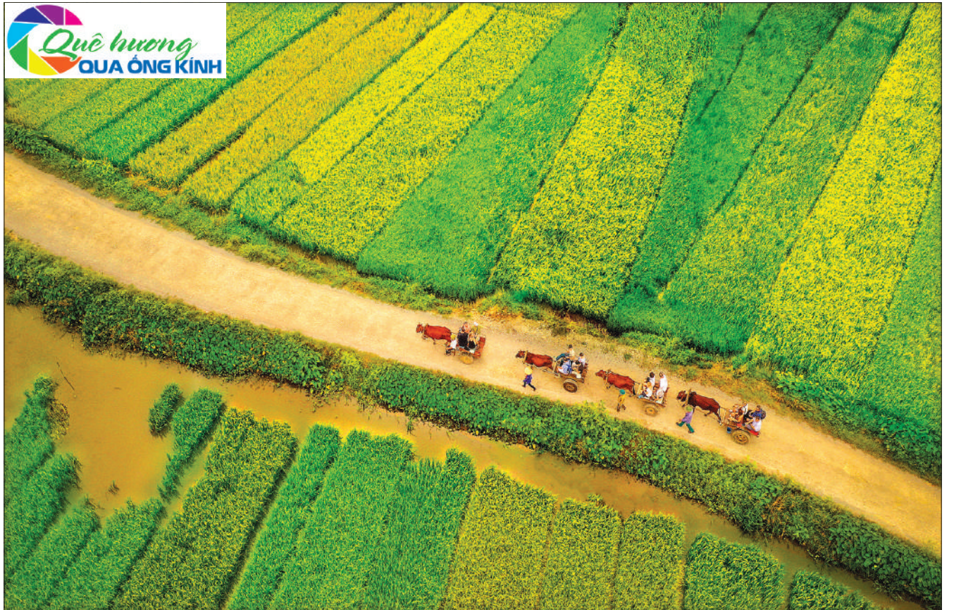
Du lịch đồng quê.