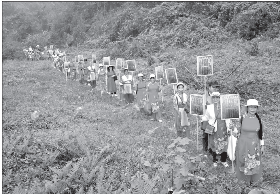
Nghi lễ rước "Khiết Đùn từ 36 quê" tại lễ hội Đền Cát Đùn, xã Gia Hưng (Gia Viễn).