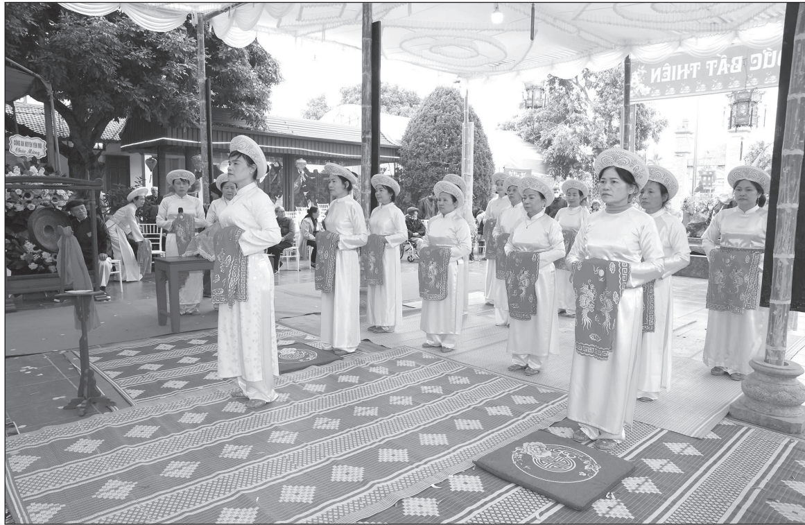
Nghi lễ Tế Nữ quan tại Lễ hội Báo Bản làng Nộn Khê, xã Yên Từ (Yên Mô).

Thời gian qua, công tác quản lý hoạt động lễ hội trên địa bàn huyện đã được tăng cường. Trong đó, tập trung tuyên truyền, phổ biến đến đông đảo cán bộ, đảng viên và các tầng lớp nhân dân với nội dung, hình thức phong phú, đa dạng như: Thông qua hệ thống truyền thanh, tuyên truyền trên trang thông tin điện tử, tuyên truyền trực quan, lồng ghép thông qua hội thi, hội diễn, sinh hoạt... vận động nâng cao ý thức, trách nhiệm của các cấp, các ngành, Nhân dân và du khách trong thực hiện các quy định của Nhà nước về lễ hội; tuyên truyền, giới thiệu về nguồn gốc của lễ hội, di tích và các nhân vật được thờ phụng, tôn vinh; về các giá trị, ý nghĩa đích thực của tín ngưỡng và nghi lễ truyền thống của dân tộc.